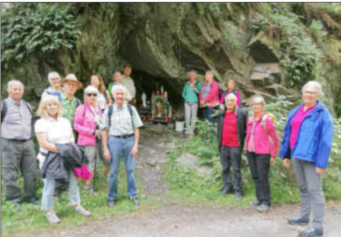
Eine der Gebetsstationen auf der Wanderung entlang des Wacholder-Endert-Pfades war eine Grotte mit einer Herz-Jesu-Figur am Enderttal, wo auch die Mittagsrast gehalten wurde.

Wandernd und betend auf dem Wacholder-Endert-Pfad