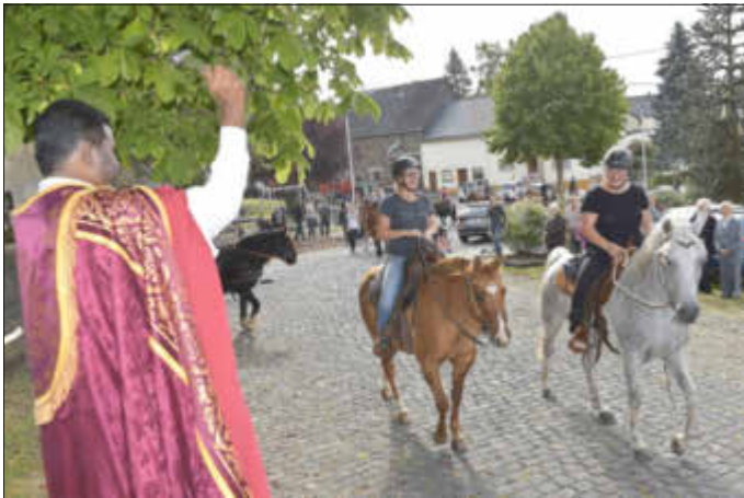
hier Fotos von 2019