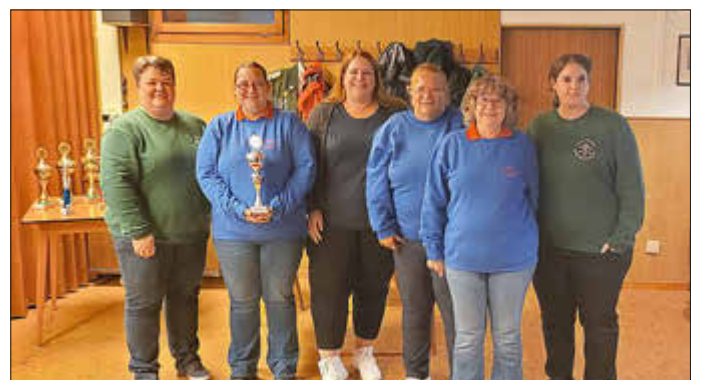
Die Damen des SFK Ulmen präsentierten sich wieder einmal besonders stark