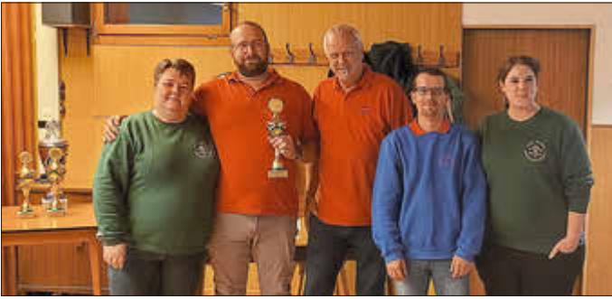
Die Herrenmannschaft I des SFK Ulmen belegte den dritten Gesamtplatz