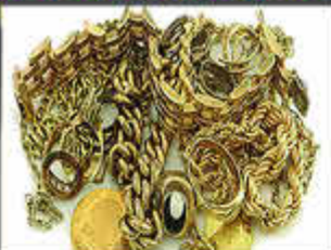
Wir kaufen Ihren Schmuck!