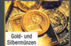
Gold- und Silbermünzen

ANTIKER KORALLENSCHMUCK, KORALLENKETTEN, KORALLEN- SCHNITZEREIEN (bevorzugt in blutrot) ZAHNGOLD (mit und ohne Zähne), PELZMÄNTEL MILITÄRORDEN SERIÖSER ANKAUF