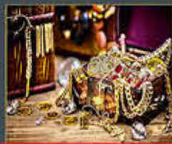
Wir kaufen auch Modeschmuck