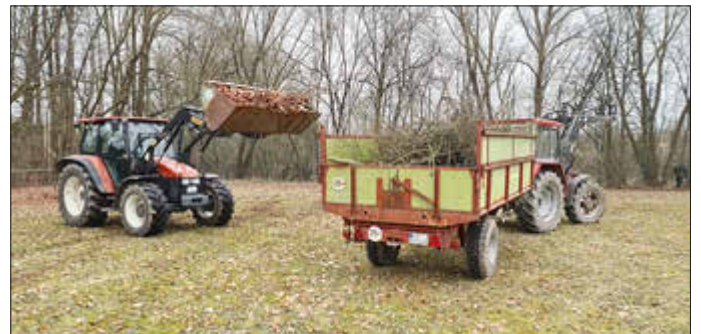
Schweres Gerät im Einsatz

...ganz nach diesem Motto fand letzten Samstag auf Initiative der Freizeitmannschaft Gillenbeuren eine große Räum- und Säuberungsaktion des Bolzplatzes statt. Mit tatkräftiger Unterstützung der Freiwilligen Feuerwehr Gillenbeuren wurden unter anderem die Fangzäune freigeschnitten und eingewachsene Äste und Hecken entfernt. Unter den fast dreißig Helfern waren auch viele Jugendliche und Kinder. Anschließend gab es noch ein gemütliches Beisammensein bei kühlen Getränken, deftiger Gulaschsuppe und sehr guter Stimmung. Vielen Dank, das war eine tolle Aktion!