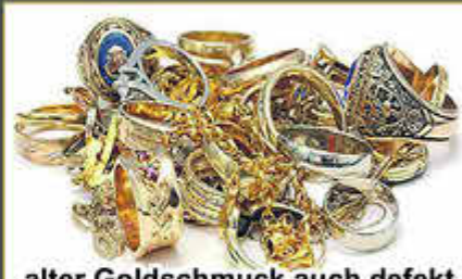
alter Goldschmuck auch defekt

Gerne prüfen wir Ihren Schmuck auf Echtheit!