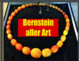
Bernstein bis zu 2500,-€