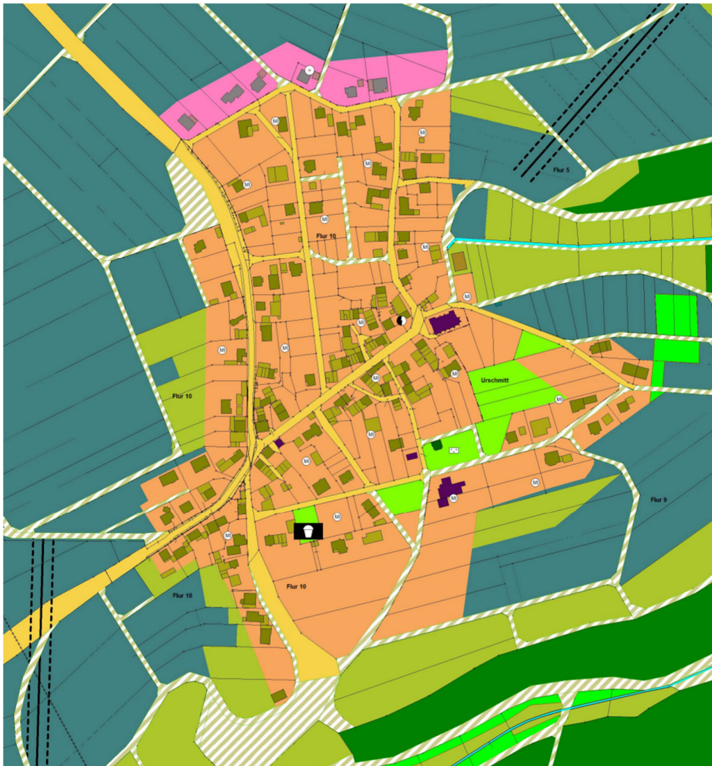
Abbildung 1: Auszug aus dem Flächennutzungsplan der Verbandsgemeinde Ulmen

Der wirksame Flächennutzungsplan der Verbandsgemeinde Ulmen stellt für die Planbereiche überwiegend „Mischbauflächen“ dar. Lediglich im Norden wird eine Bauzeile als Wohnbauflächen dargestellt.